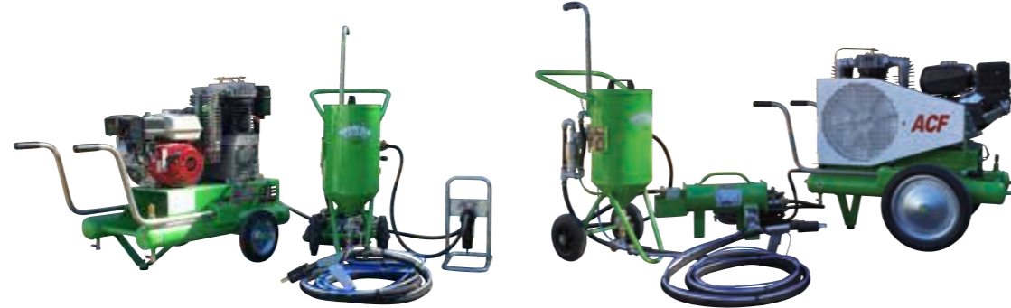
KIT TOPOLINO 18